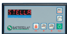
Console comandi Control panel