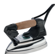
Dotazione ferro da stiro mod. EOS (fornito standard) Supplied with EOS iron (standard equipment)